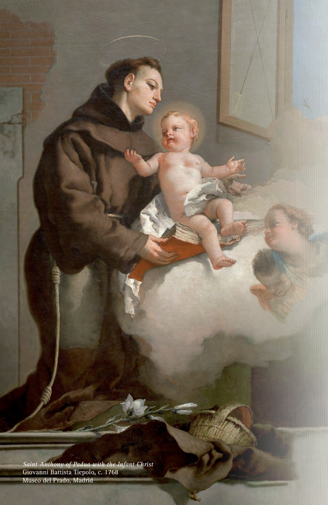
Saint Anthony of Padua with the Infant Christ Giovanni Battista Tiepolo, c. 1768 Museo del Prado, Madrid