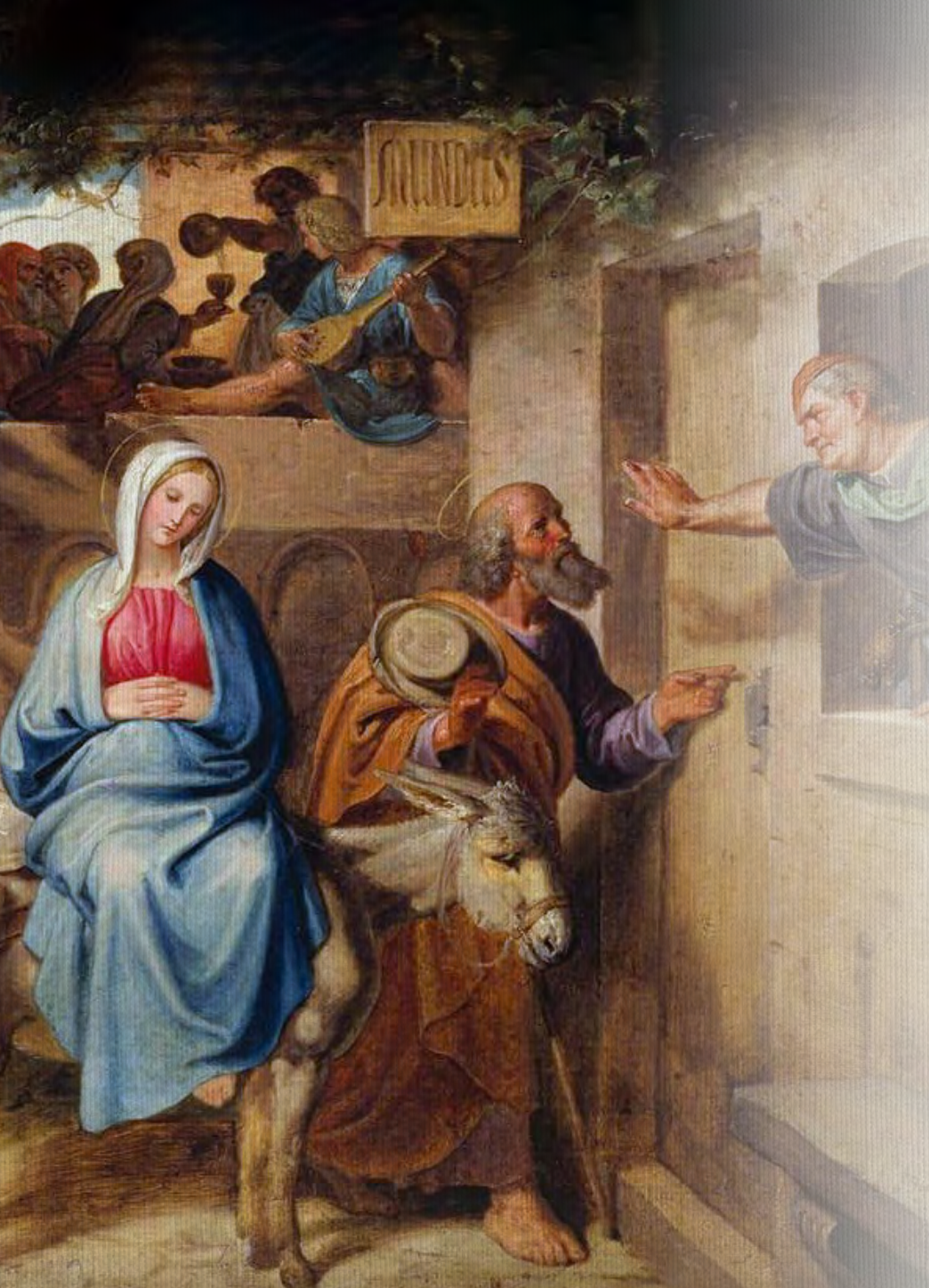
Arrival at the Inn in Bethlehem Joseph von Führich Staatliche Museum, Berlin